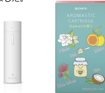
AROMASTIC 本体と AROMASTIC CARTRIDGE Hawaii の香りのパッケージ パッケージは、ハワイのデザインブランド「ニコメイド」のデザイナーである ニコール・フェララが担当

同商品は、ハワイを感じられる5つの香りが1つのカートリッジとなっています。 AROMASTIC 本体 にそのカートリッジをセットすることでハワイ特有の5つの香り（オヒアレファ、リリコイ、ピカケ、ハチミツ、ココナッツ）をそれぞれ楽しむことができるパーソナルアロマディフューザーです。