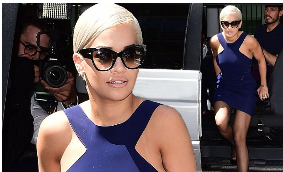
シンガーのリタ・オラ

The World's Most Unique Eyewear Collections